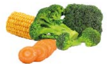
VEGETALES AL VAPOR