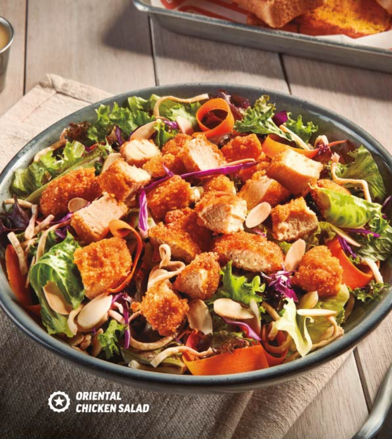
ORIENTAL CHICKEN SALAD