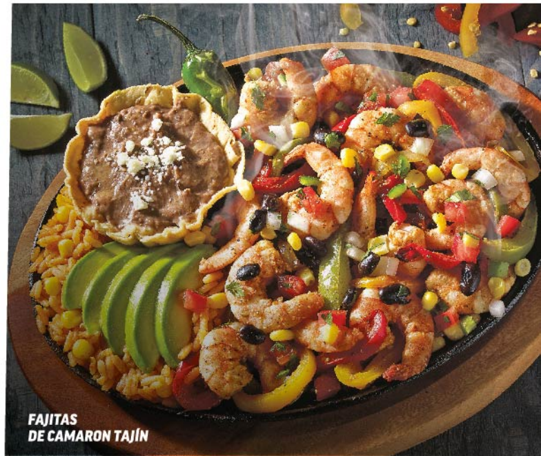
FAJITAS DE CAMARON TAJÍN