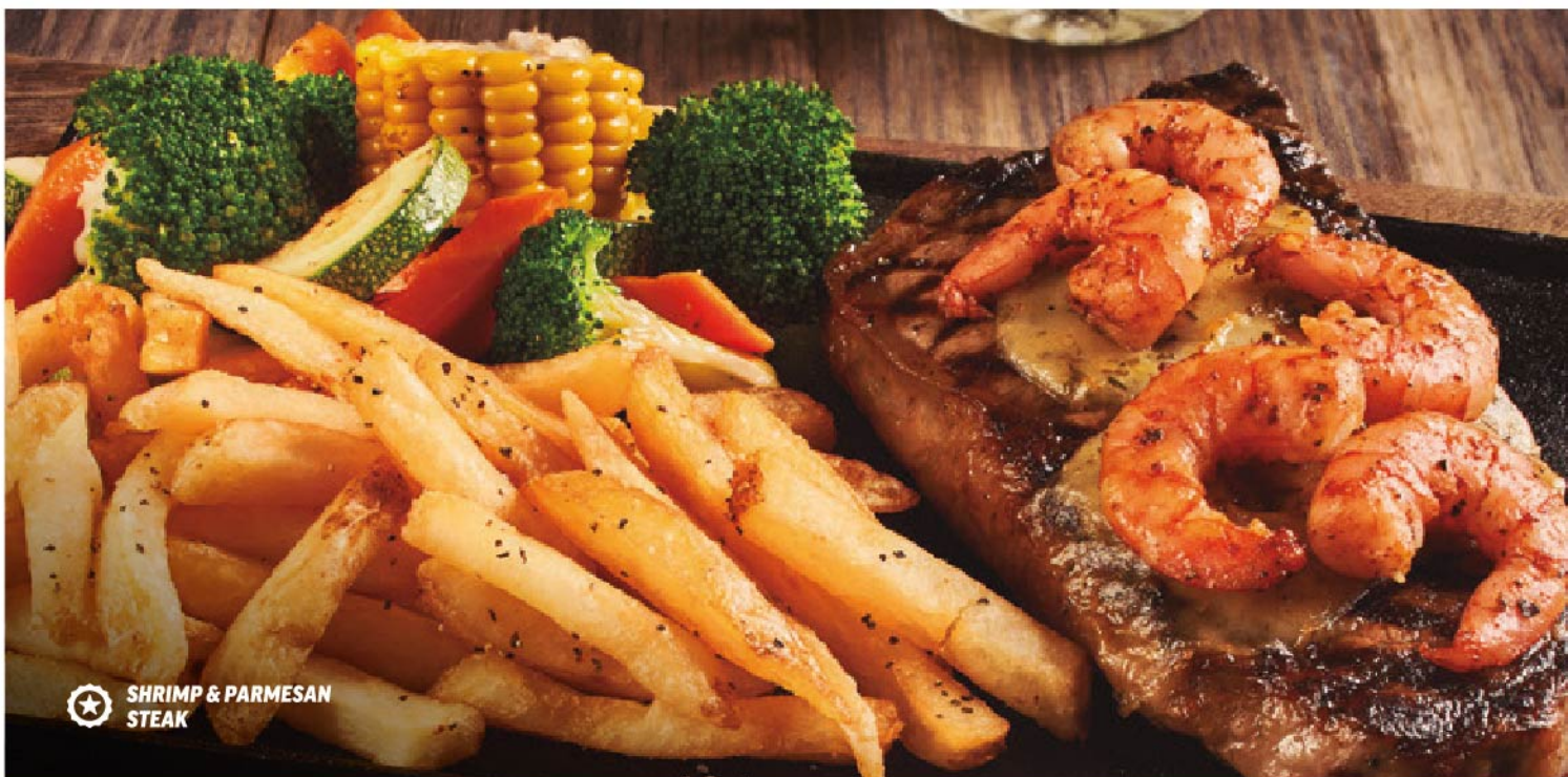
SHRIMP & PARMESAN STEAK