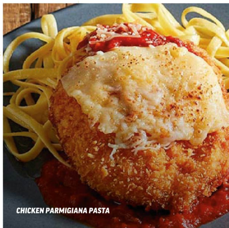
CHICKEN PARMIGIANA PASTA