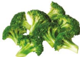
BRÓCOLI 3 oz.