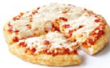
PIZZA Queso- Jamón -Pepperoni La pizza no incluye complemento