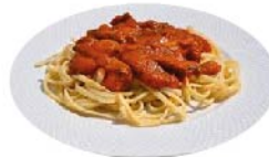
PASTA EN SALSAS ROJA O BLANCA