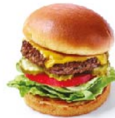
CHEESE BURGER 3 oz.