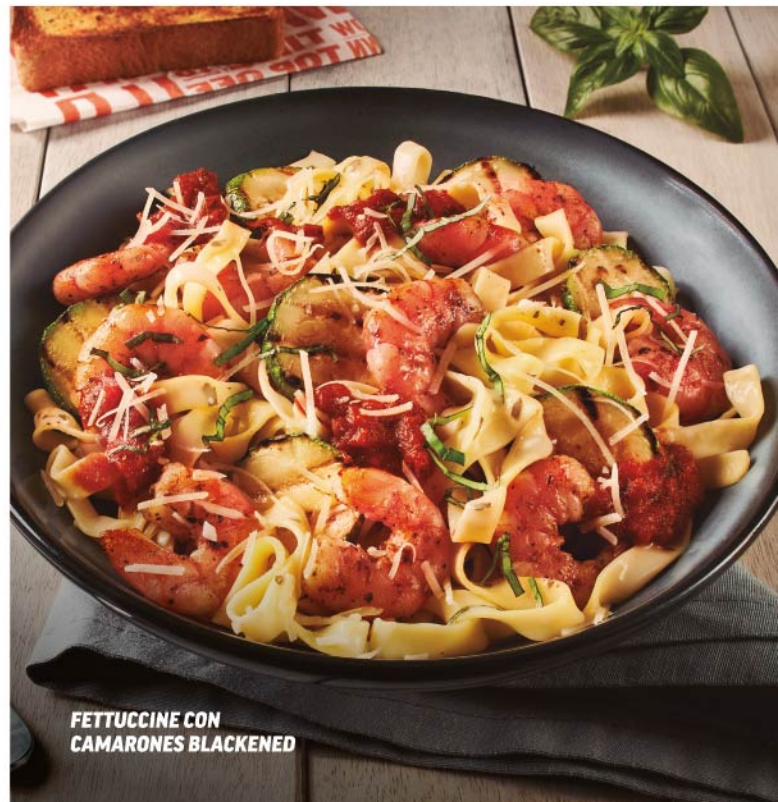
FETTUCINE CON CAMARONES BLACKENED