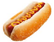
HOTDOG 1 pza.