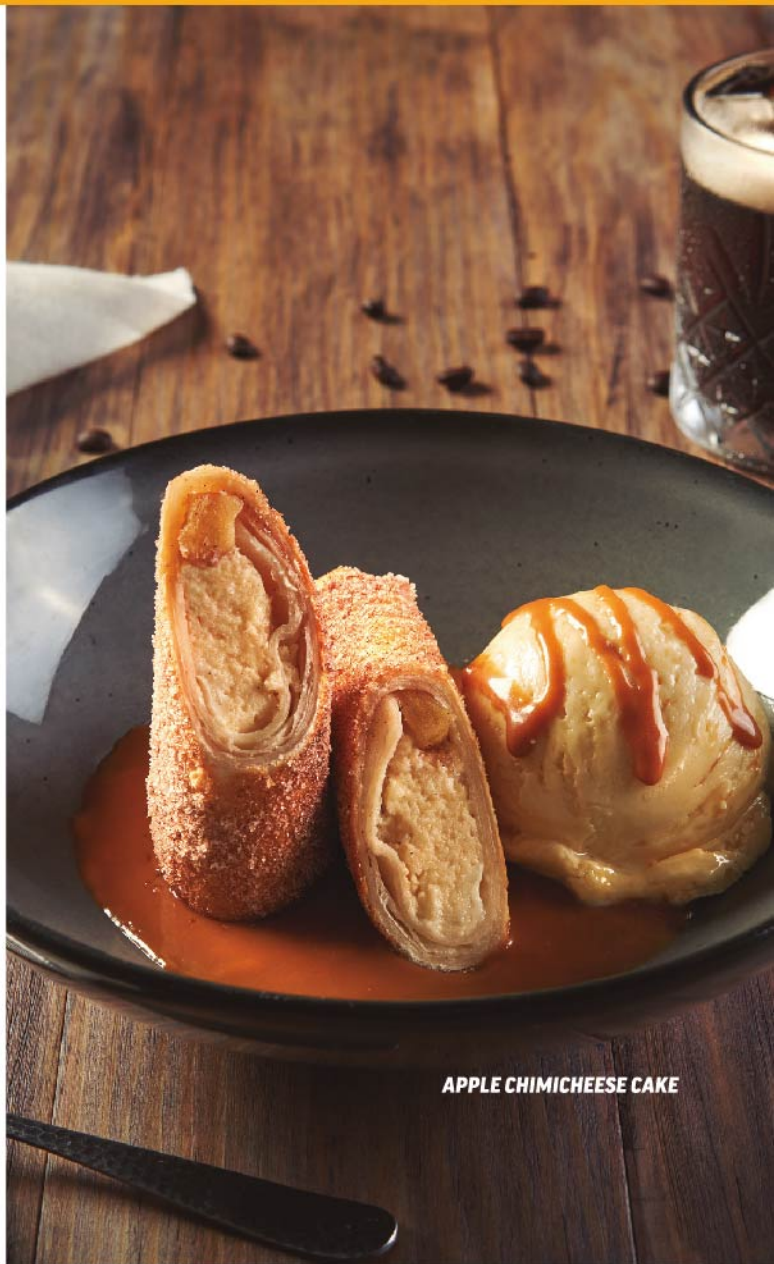
APPLE CHIMICHEESE CAKE