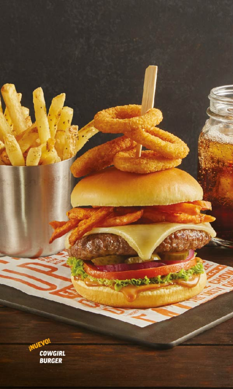
¡NUEVO! COWGIRL BURGER