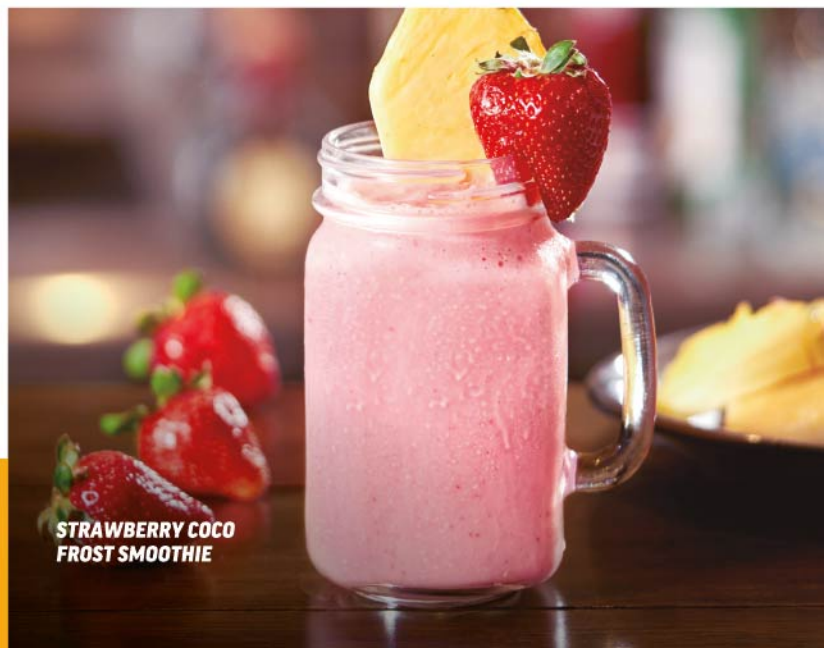
STRAWBERRY COCO FROST SMOOTHIE