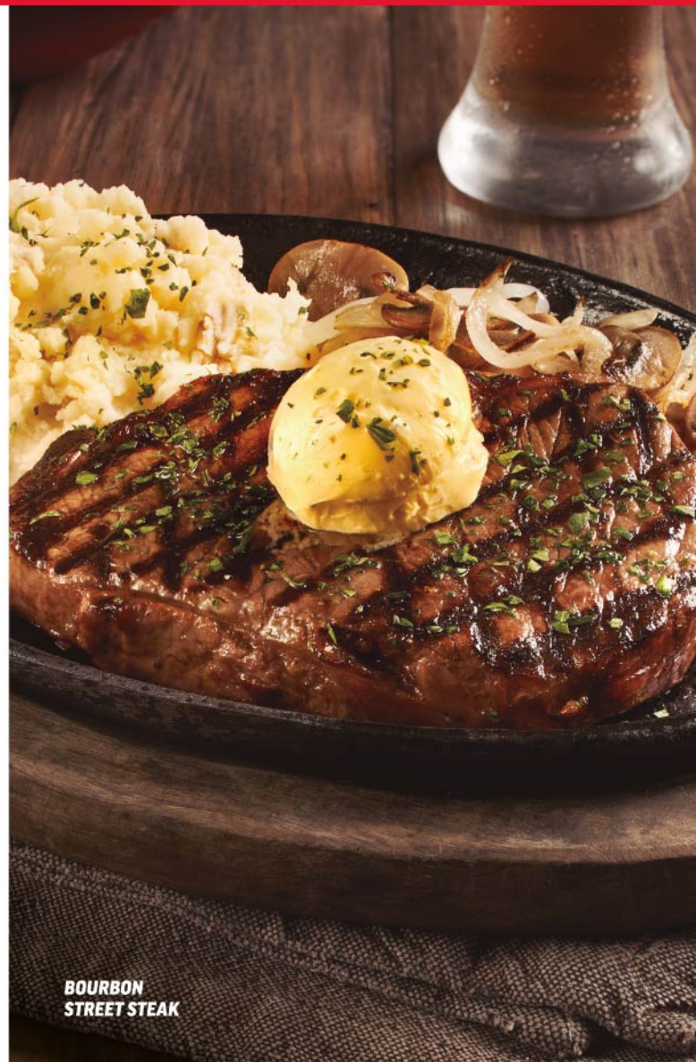
BOURBON STREET STEAK