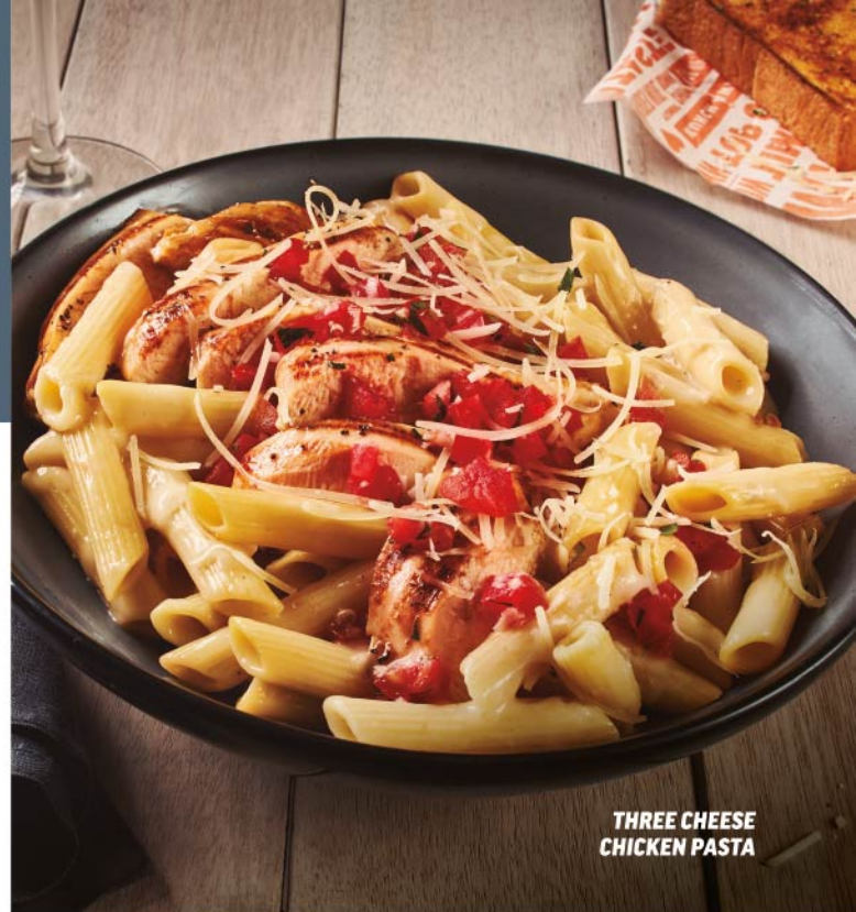
THREE CHEESE CHICKEN PASTA