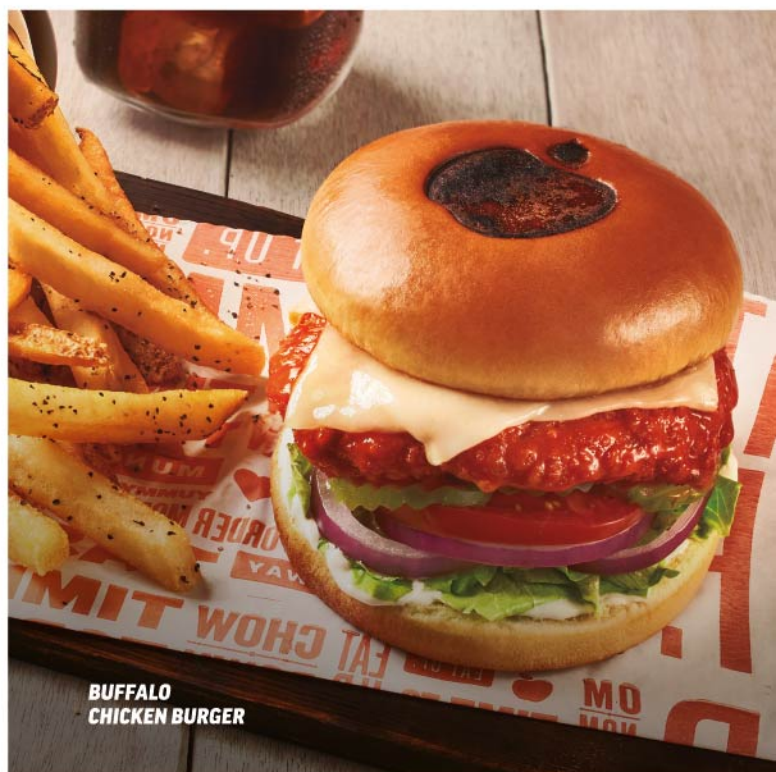
BUFFALO CHICKEN BURGER