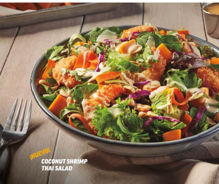
¡NUEVO! COCONUT SHRIMP THAI SALAD