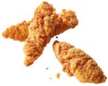
TIRAS DE POLLO 3 pzas.