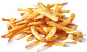
PAPAS FRITAS 5 oz.