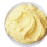
PURÉ DE PAPAS